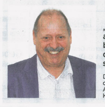
„Durch den HIP wurden aus unbekanntenen Nachbarn Geschäftsfreunde, die gemeinsame Interessen vertreten.“

KLIMASCHUTZ Ein Projekt des Handels- und Industriepark Kiel-Wellsee e.V. – zu profilieren. So bilden nach anfänglichen 30 inzwischen 150 Mitglieder Netzwerke mit anderen Interessengemeinschaften, um Betriebskosten einzusparen. Außerdem stehen sie im aktiven Dialog mit der regionalen Politik und Wirt-