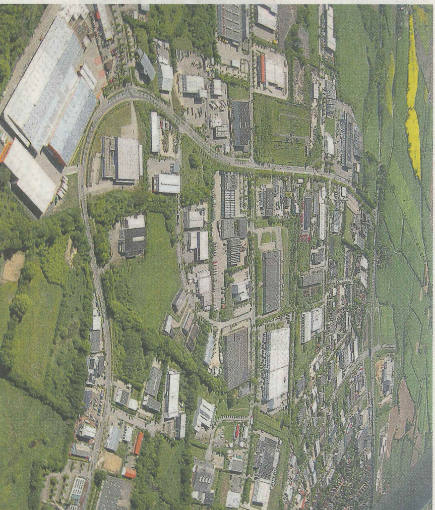
Über eine Fläche von 160 ha erstreckt sich das Gewerbegebiet Wellsee.

So stehen sowohl ökonomische als auch ökologische und soziale Aspekte im Fokus des Vereins. Ein erfolgreiches Konzept, um die Wettbewerbsfähigkeit des Wirtschaftsstandortes Kiel auch in Zukunft weiter auszubauen.